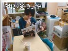
PM12:30 ランチ 休憩中でも業界誌を見て勉強中。