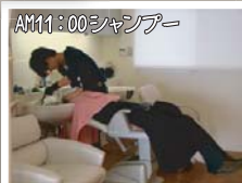
AM11:00 シャンプー シャンプー好きなお客様が多いです よね...、「気持ちよかったよ」なんて 言われたらすごく嬉しいです。