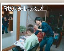
PM20:30 レッスン モデルさんに来てもらってアップのレッスン です。モデルさんにはいつも助けられて、 感謝しています。