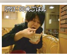
PM23:00 晩ごはん 晩ごはんは先輩とよく行きます。 外食が多いけど、たま〜に自炊してます。