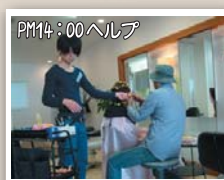
PM14:00 ヘルプ この日はパーマのヘルプ。 ただ口外を渡す単純作業だけど、 コレもとても大切な仕事なんです!