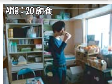
AM8:20 朝食 出勤してからホッと一息。 ミルクティーと豆乳は毎日欠かしません。(笑)