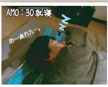
AM0:30 快寝 あ〜疲れた... でも今日も充実した 一日が送れました♪ 素敵な美容師目指して明日も頑張るぞ! ↑↑↑