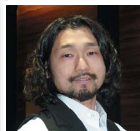
hair's Muu+ 外村 満

自分出来る事くらいは、一生懸命やりましよう。それで、少しずつ出来る事が増えていけばいいと思ひます。未来の子供たちの為に、僕達の出来る事ががんばって行きましよう。