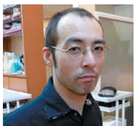
u-m&Rita 上月 弘

社会に出たら楽しい事、嬉しい事、明るい夢、希望など、多くの事が待っています。でもそれらは決して自分一人の力では叶える事は出来ません。理美容業を通じて、多くの人々から学び、感謝し、共に成長して夢や目標にたどり着くのだと思ひます。その過程は辛い事、悲しい事もあるかもしれませんが、そんな時に助け合える仲間を作つて行きましよう